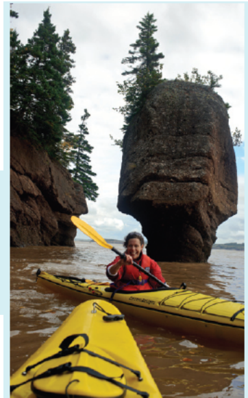
Un membre d'un club de kayak pagaie près de Hopewell Rocks, au Nouveau-Brunswick.