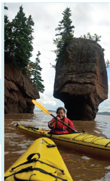
Un membre d'un club de kayak pagaie près de Hopewell Rocks, au Nouveau-Brunswick.