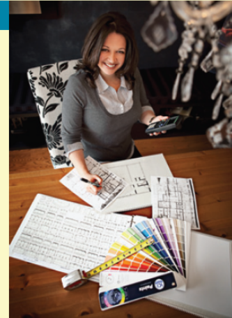
Dans le cadre de son travail, Andrea assortit les couleurs avec goût et finesse.

Un entrepreneur autonome pourrait contracter un prêt afin de faciliter le démarrage d'une entreprise et ainsi couvrir les coûts des matières premières et de l'équipement. Si Andrea contractait un prêt pour couvrir ses dépenses, elle devrait calculer le coût total de son prêt avec les intérêts. Ainsi, elle pourrait faire le suivi de ses dépenses. Si Andrea contractait un prêt de 20 000,00 $ et qu'elle le remboursait en 12 versements mensuels de 1 698,43 $, quel serait le coût total de son prêt?